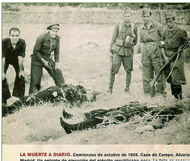
LA MUERTE A DIARIO. Comienzos de octubre de 1936. Casa de Campo. Afueras Madrid. Un pelotón de ejecución del ejército republicano pasa la foto a...

Con todo, ¡que nadie se distraiga! Ha empezado una nueva ofensiva contra el «Valle».